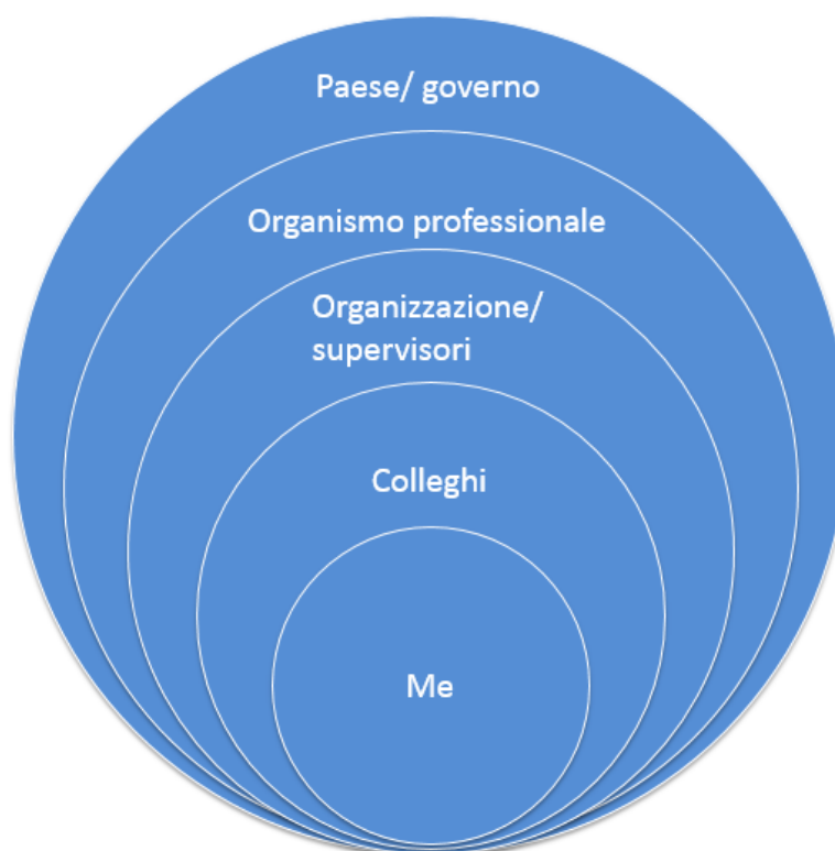
Diagramma sui cerchi di influenza:

Esempio esplicativo: immagina che vuoi adottare una delle prassi commentate durante la formazione, ma ti preoccupa che non è attualmente utilizzata all'interno della tua organizzazione.